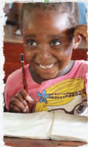
„Bildung ist der Schlüssel zu einem selbstbestimmten Leben: terre des hommes sorgt dafür, wie hier in der mosambikanischen Hauptstadt Maputo.“